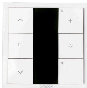
ART NO 210963-ER Wall transmitter, 1-KANAL