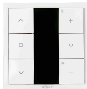
ART NR 210963-ER Väggsändare, 1-KANAL