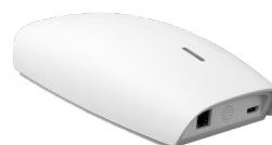
ART NR 211040 WiFi Box for APP-control