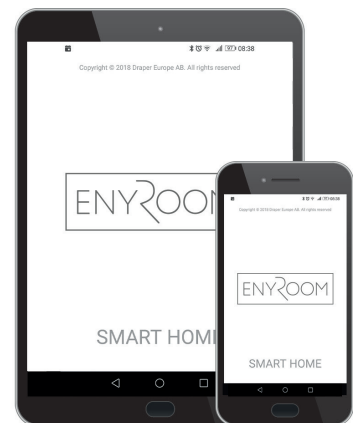
SMART HOME ENYROOM APP