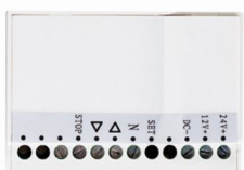
ART NR 210965-ER Dry contact transmitter