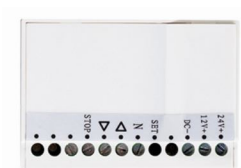
ART NO 210965-ER Dry contact transmitter