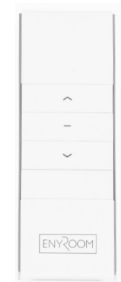
ART NR 210944-ER FJÄRR, 1-KANAL