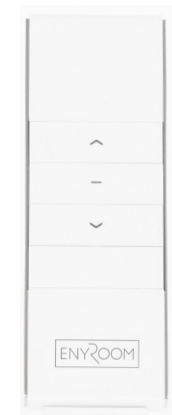
ART NO 210944-ER Remote, 1-CH