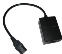
ART NO 210907-ER Autolink trigger